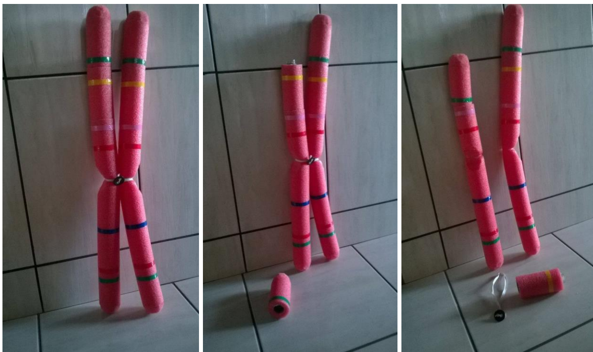
Figura 2. Material didático para o estudo do cromossomo

Objetivos: O modelo (Figura 2) tem a finalidade de discutir o conteúdo de Genética no Ensino Médio; representa a estrutura externa de um cromossomo, demonstrando as cromátides-irmãs, centrômero, genes; e na presença de mais um modelo retrata-se os cromossomos homólogos, simbolizando o crossing over ou permutação; inversão, deleção, duplicação e translocação gênica. A genética é descrita como uma disciplina muito abstrata, segundo depoimento de muitos estudantes, pois reproduz toda informação necessária à hereditariedade que é transmitida pela “mensagem” contida no DNA/cromossomo. Tais conceitos são arduamente “assimilados” durante o processo ensino e aprendizagem porque muitos alunos têm dificuldade em “concretizar” a estrutura do cromossomo que é a base para todo estudo genético.