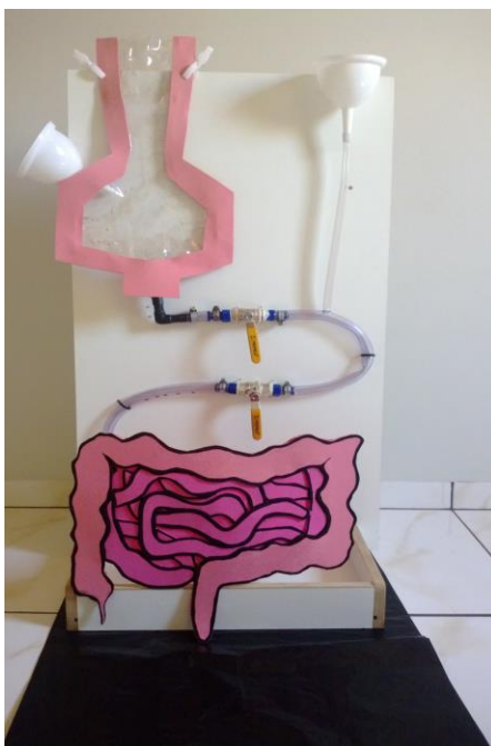
Figura 1. Material didático para o estudo do sistema digestório

Objetivo: Este material (Figura 1) pode ser utilizado tanto nas séries finais do Ensino Fundamental como no Ensino Médio, nas disciplinas de Ciências e Biologia e tem por finalidade auxiliar no estudo de anatomia e fisiologia do sistema digestório humano. O uso do material didático permite assegurar a atenção e incremento na assimilação do conhecimento pelos alunos (pois instiga suas curiosidades), além de ser um recurso didático para auxiliar o professor nas atividades no âmbito escolar. Despertar o interesse dos alunos pelo conhecimento científico é um dos grandes desafios da escola, uma vez que esta muitas vezes deve driblar e “competir” com recursos digitais que inundam o entorno do cotidiano dos alunos.